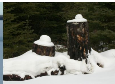
Eis, das sich nach oben gedrückt hat